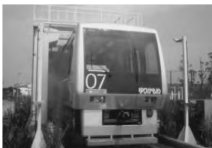
再生水による車両洗浄

その他、ダイオキシン類対策特別措置法などにより規制されています。（図表10-9及び10-10参照）。