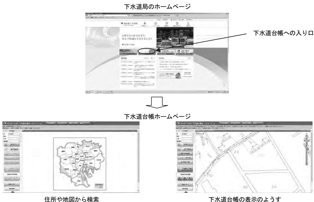
図表2-7 下水道台帳ホームページのイメージ