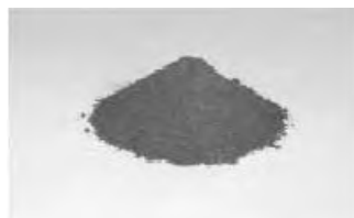
粒度調整灰（スーパーアッシュ）

現在では、汚泥焼却灰に含まれる放射能濃度の低下により、下水道工事で使用する鉄筋コンクリート管の材料である粒度調整灰（スーパーアッシュ）の製造のほか、軽量骨材原料や炭化物などとして、汚泥を資源化しています。