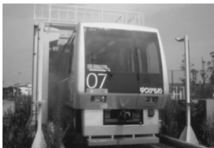
再生水による車両洗浄

その他、ダイオキシン類対策特別措置法などにより規制されています。（図表10-9及び10-10参照）。