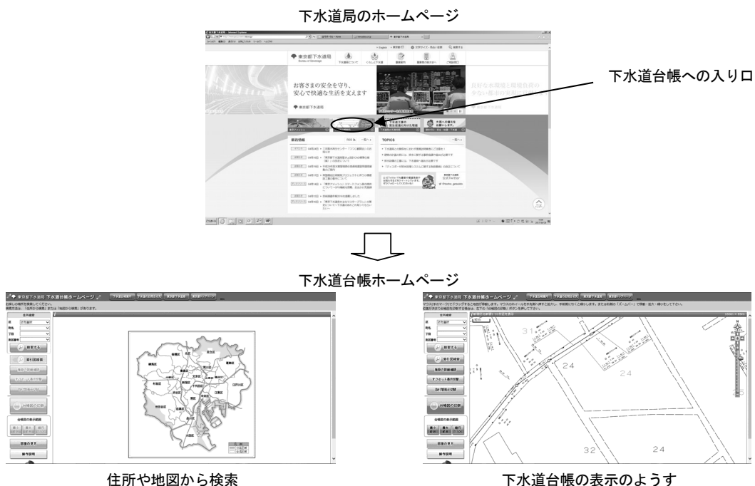
図表2-7 下水道台帳ホームページのイメージ