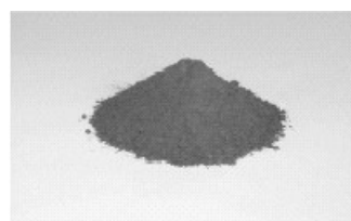
粒度調整灰（スーパーアッシュ）

現在では、汚泥焼却灰に含まれる放射能濃度の低下により、下水道工事で使用する鉄筋コンクリート管の材料である粒度調整灰（スーパーアッシュ）の製造のほか、軽量骨材原料や炭化物などとして、汚泥を資源化しています。