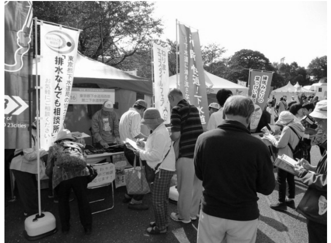
図表8-4 「油・断・快適！下水道」PRイベント

下水道事業のPRだけではなく、地域のお客さまとのつながりを大切にしています。また、職員の環境・エネルギーに対する意識の高揚策の実施や、活動の取組結果をまとめた環境・エネルギー報告書の公開などを行っています。