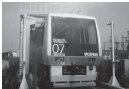
再生水による車両洗浄

その他、ダイオキシン類対策特別措置法などにより規制されています。（図表10-9及び10-10参照）。また、水質汚濁防止法により総量規制が実施され、COD、窒素含有量、りん含有量の汚濁負荷量も規制されています（図表10-31参照）。