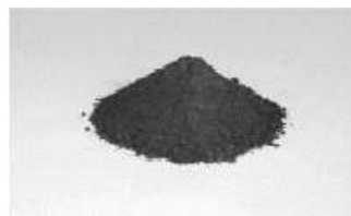
粒度調整灰（スーパーアッシュ）

現在では、汚泥焼却灰に含まれる放射能濃度の低下により、下水道工事で使用する鉄筋コンクリート管の材料である粒度調整灰（スーパーアッシュ）の製造のほか、軽量骨材原料や炭化物などとして、汚泥を資源化しています。