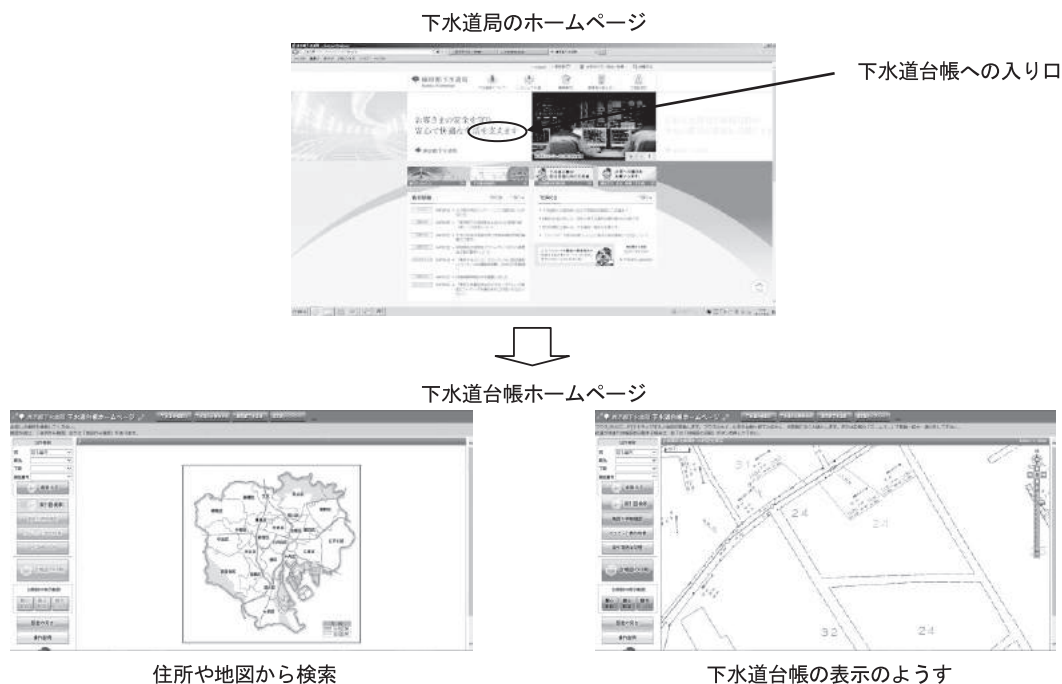
図表2-7 下水道台帳ホームページのイメージ