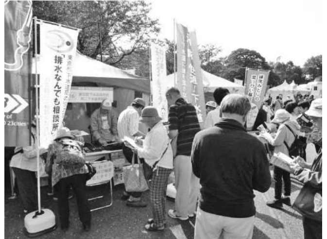
図表8-4 「油・断・快適！下水道」PRイベント

PR活動にも取り組んでいます。こうした取組により、下水道事業のPRだけではなく、地域のお客さまとのつながりを大切にしています。また、職員の環境・エネルギーに対する意識の高揚策の実施や、活動の取組結果をまとめた環境・エネルギー報告書の公開などを行っています。