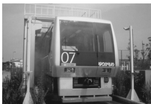
再生水による車両洗浄