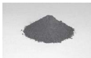
粒度調整灰（スーパーアッシュ）

埋立処分地は有限であり、都市で発生した汚泥を重要な資源として、都市づくりに役立たせる必要が求められていることから、汚泥の資源化を積極的に進めています。しかしながら原子力発電所事故の影響により、汚泥から放射性物質が検出され、資源化量は大幅に減少しています。