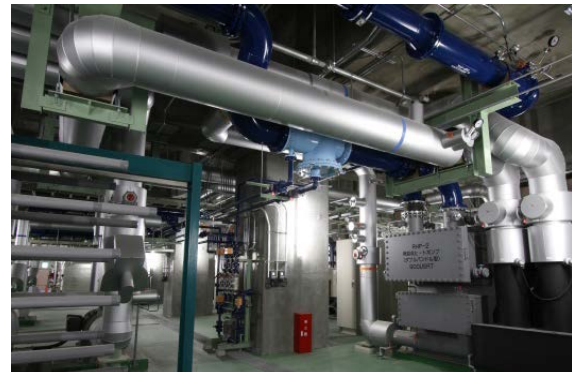
下水熱を利用した空調設備建物全体の冷暖房を賅います。