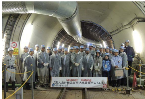
マレーシア国の行政等技術者による 工事現場の視察

また、本プロジェクトは、国土交通省など国の支援も受けながら進めてきた事業であり、政府が目指すインフラシステム輸出戦略の下水道分野におけるリーディングケースとして、他の自治体や民間企業の国際展開に弾みをつけるものでもあります。