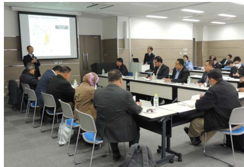
マレーシア国下水道関係職員による 東京都下水道施設の視察研修の様子