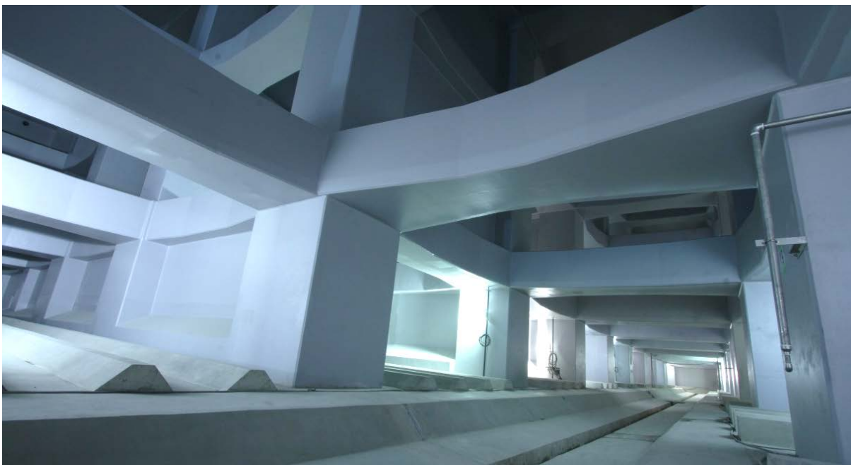
「品川シーズンテラス」の地下に設けられた雨天時貯留施設降雨初期の特に汚れた下水を貯留することで、東京湾の水質改善に寄与します。