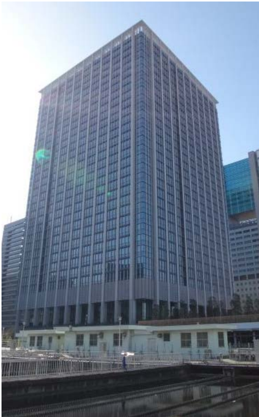
芝浦水再生センターの上部を利用した環境配慮型ビル「品川シーズンテラス」

また、新たに整備されたオープンスペースは既存の公園と一体で利用できるほか、ヒートアイランド現象を緩和する風の道としても活用されます。