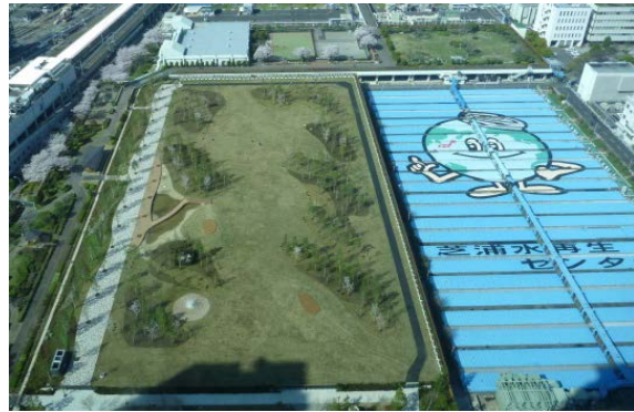
新たに整備されたオープンスペース芝浦中央公園と一体で利用できます。