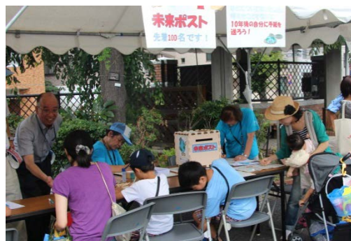
10年後の自分に手紙を送る 水再生センターの「未来ポスト」