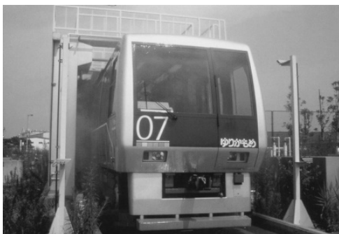
再生水による車両洗浄