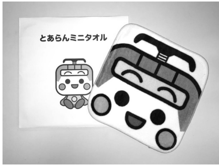
【紙袋（左）による個包装の例】