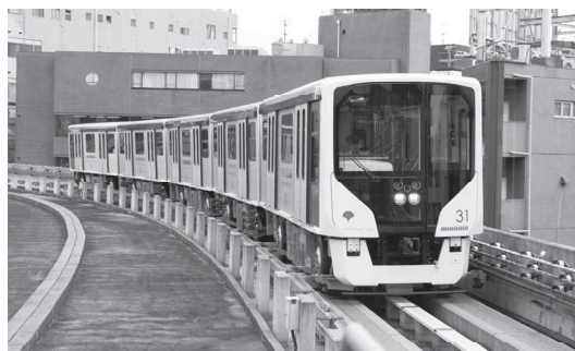
【日暮里・舎人ライナー330形車両】