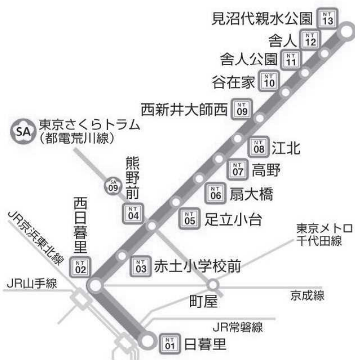
NT 日暮里・舎人ライナー 路線図